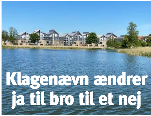
Det har taget næsten fire år at få afgjort, om der må bygges en 30 m lang bro ved Søbyen i Skanderborg. Svaret er nej.